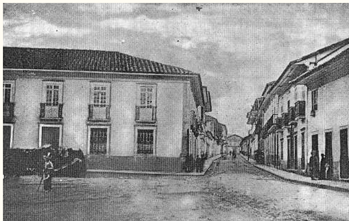
foto do edifício contíguo à catedral da Sé

Seu currículo era praticamente idêntico ao das escolas primárias elementares, centrado no conteúdo a ser ensinado. Segundo o Anuário do Ensino do Estado de São Paulo, de 1907/1908, esse currículo contemplava a Gramática (geral e da língua nacional), Aritmética (até proporções), Geometria (noções gerais e aplicações usuais), Caligrafia, Lógica, Religião, além de rudimentar formação pedagógica, com estudos do que no Anuário é chamado de "métodos e processos de ensino, sua aplicação e vantagens comparativas". Observa-se, nesse currículo, a ausência das disciplinas de