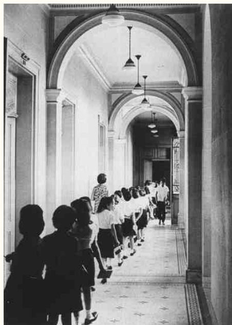
Saída para o recreio (década de 1970) - Foto usada no movimento de resistência à demolição.