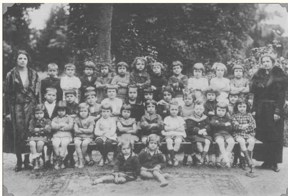
Grupo de alunas do Jardim da Infância, em 1924

Escola-Modelo Complementar da Capital, para alunos de 11 a 14 anos, destinada a formar professores primários em tenra idade, chamados de complementaristas.