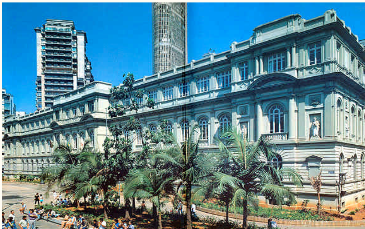
Foto do edifício inaugurado em 1894 para abrigar a Escola Normal, na Praça da República (centro de São Paulo), atualmente sede da Secretaria de Estado da Educação de São Paulo.

Atual: EE Caetano de Campos São Paulo – SP