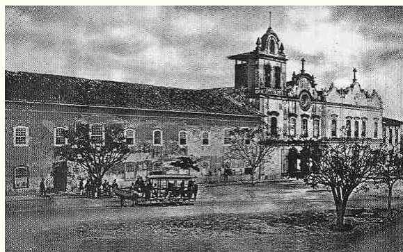
Fac. de Direito de São Paulo, no Largo de São Francisco - Curso Anexo.