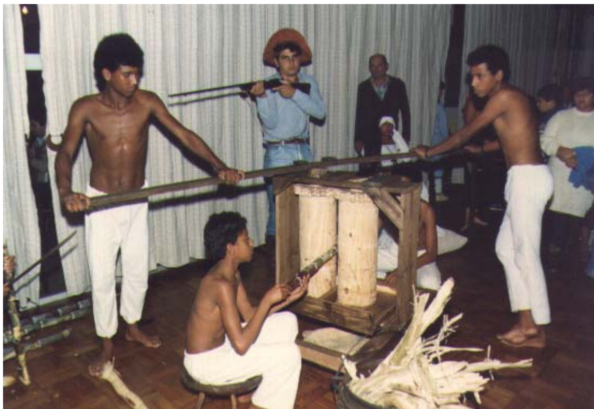
Figura 06. Comemoração dos “100 anos de Libertação da Escravidão no Brasil” apresentado pelos alunos da 8ª série. 1988.