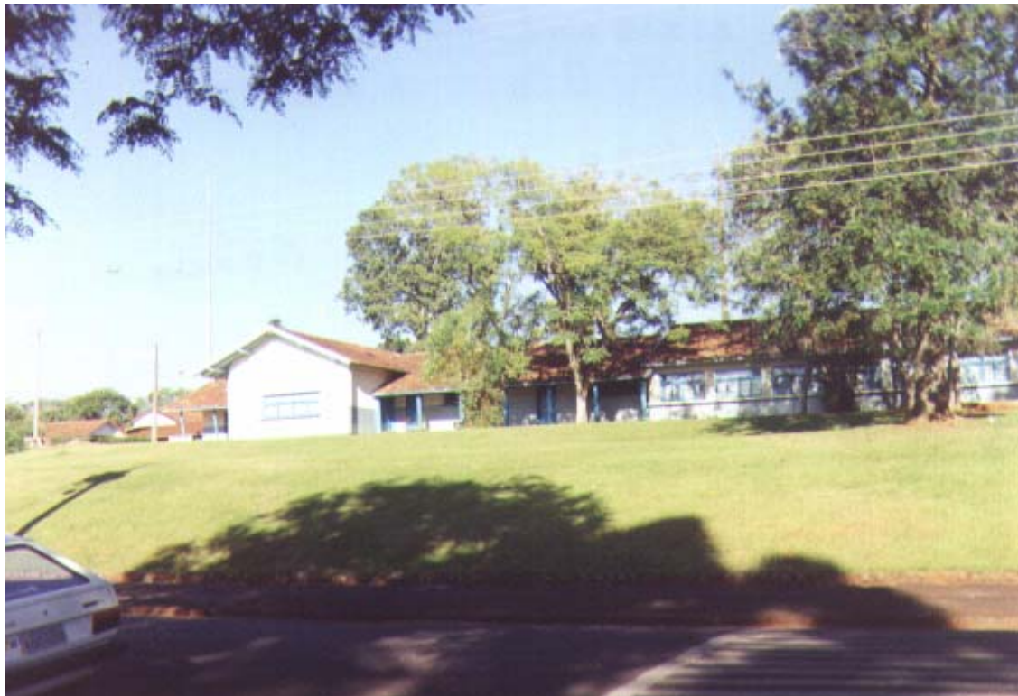
Figura 03. Vista parcial do “Colégio Estadual Manoel Ribas”, na década de 60, chamava-se Grupo Escolar “Manoel Ribas”, em Harmonia – Monte Alegre, propriedade particular do Grupo Klabin. 2000.

Por outro lado, a realidade do ensino primário e secundário desenvolvido em meio século de história em Cidade Nova nas instituições públicas de caráter municipal e estadual, como: a Escola Rural “Princesa Isabel”, o Ginásio Estadual de Cidade Nova (atualmente, Colégio Estadual Wolff Klabin), a Escola Estadual Isolada (posteriormente, Estadual Leopoldo Mercer) e a Escola Estadual Presidente Vargas foi o de repassar o conteúdo aos filhos do proletariado, de forma intelectual e socialmente, no sentido do aluno ser “alfabetizado e educado”.